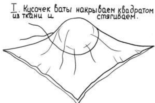
Рис.1. Схема-алгоритм изготовления Куклы-закрутки.

II. Сформировав голову, оставшуюся ткань наматываем в столбик.