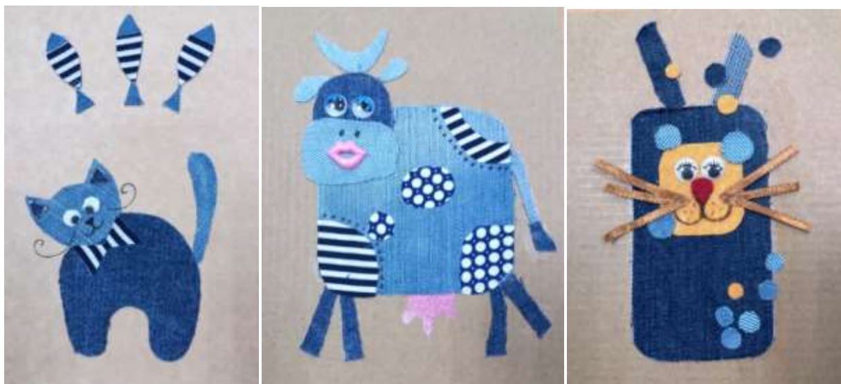
Рис.10. Сочетание джинсовой ткани с ситцем, кружевами, фетром.