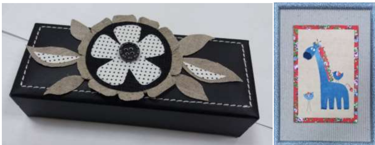
Рис.3. Порядок выполнения открытки в технике аппликации из джинсовой ткани (сокращённый алгоритм мастер-класса), подсказка для Учеников:

Порядок выполнения открытки в технике аппликации из джинсовой ткани: